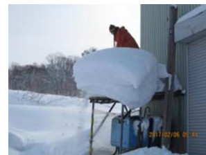
石油タンクの庇も除雪します