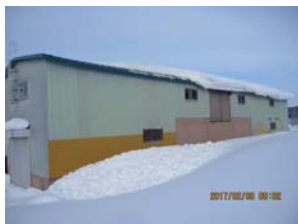
2月6日午前9時頃の倉庫のようす～これから倉庫の屋根に積もった雪を落とします

最近、新聞紙上をにぎわしているのが、JR北海道による鉄路撤退の問題です。廃止計画が公表された沿線自治体の組長であれば心中穏やかではないはず。もとより、バスに転換されれば解決するという話ではありません。これは、地域とくに地方における今後のあり方をどうするかという問題です。JRと沿線自治体だけでなく、北海道や国が責任を持って関わるべき問題かと思ひます。特に、国の責任は重いと思ひますので、しっかりと議論に加わり結論を出してもらいたいものです。何たって北海道は広いですから。