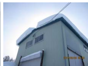
取りあえず完了です～午前9時40分