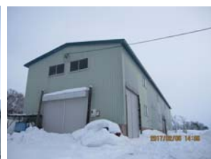
見事に屋根雪が落下しました～午後3時頃