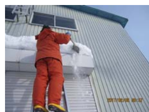
シャッターの底に積もった雪の除雪