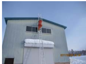
命綱を肩にかけて慎重に上ります