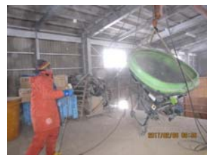
融雪剤散布機の準備～倉庫の2階からクレーンで機械を下ろす作業(2月6日)