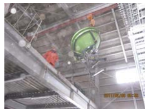
事故がないように慎重に下ろします