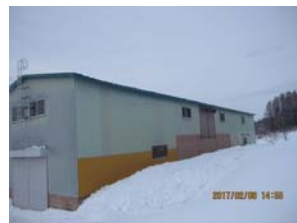
裏側もスッキリしましたね(笑)