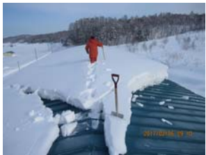
屋根の尾根部分を除雪します