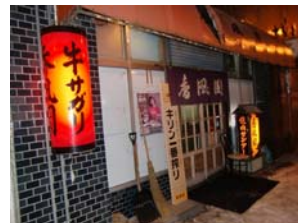
2月16日、北見市に行く機会があり、人気の焼肉屋「香風園」さんに行ってきました