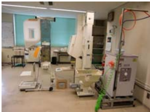
精米プラント(左)と社長のキャラクター入りポリ袋が貼られた冷蔵庫の扉(中)