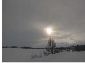
初日の出です(深川市内にて)(1月1日)