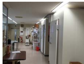
社屋には3台の大型冷蔵庫が並ぶ(1月8日)