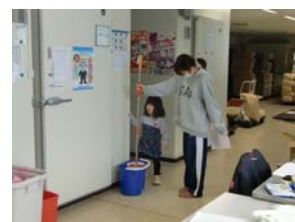
こちらは床を清掃中の奥様と娘さんです