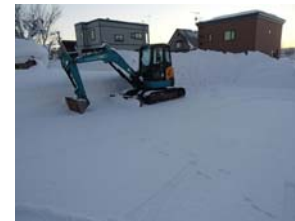
雪山を均すためのミニユンボ(1月15日)