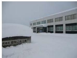
2016年元旦の朝の弊社全景と注連飾り～穏やかな新年の始まりです(1月1日)

新しい精米機は今月中旬に据え付けを行い、下旬頃から稼働を始める予定です。現在、週に2回ほど精米作業を行っています。その都度精米以上に時間をかけて、精米機などライン内部の清掃を行っています。「美白米スター」は清掃などのメンテナンスもやり易いようで、作業の負担が少しでも減ることを願っております。