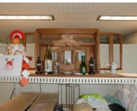
本社の中に鎮座した神棚(1月1日)