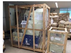
社屋内に運び込まれた新しい精米機～稼働が楽しみです(1月13日)